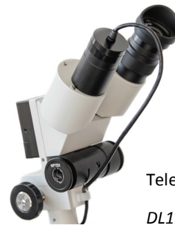
Telecamera USB DL1